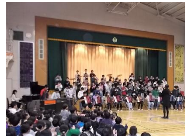
6年合奏「シング・シング・シング」

会場の体育館には、温かい感謝の気持ちが溢れ、とても素敵な空間でした。最後に6年生が発表した合奏「シング・シング・シング」は、1～5年生の拍手に包まれ、秋の音楽会とはまた一味違った、喜びに満ちた明るい演奏でした。