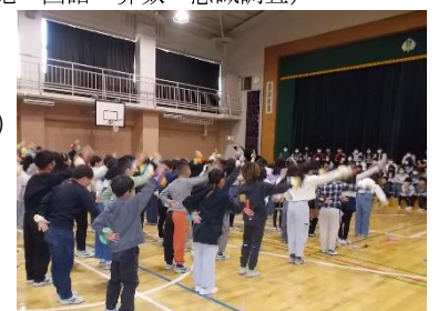
3年ダンス「はいよろこんで」