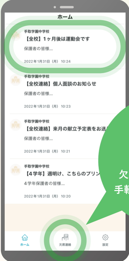
tetoru ホーム画面 ▶

スマートフォンアプリで学校からの連絡を受けたり、すばやく欠席連絡を学校に届けることができます。