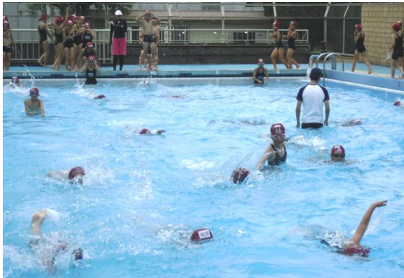
< 5年生 体育水泳学習より >