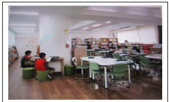
7月に完成した新学校図書館