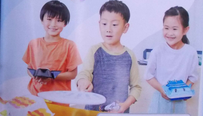
5 ぶんしんロケット (たかさ7cm)