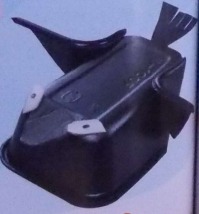
2 カラス (たかさ7cm) (はねは、きった スチレンようきを つかい)