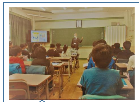
授業中、教師の話真剣に聴く児童たち。いい風景です。（4年生算数）

本校では、国や都の学力調査とは別に、独自に「標準学力調査」を2～6年（国語・算数）で実施しています。「何となく」の感覚ではなく、具体的な数値で児童の学力定着度を確認し、そこをスタートとして対処していくことを重視しています。この標準学力調査の結果も参考にしながら、「南二道場」などの補充学習の対象者をピックアップし、学力保障を進めています。