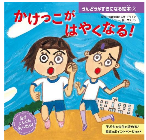
かけっこがはやくなる！ 体育指導のスタートライン 監修