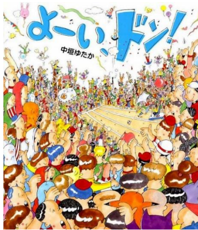
よーい、ドン！ 中垣ゆたか 作