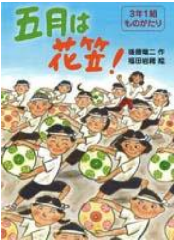
3年1組ものがたり 五月は花笠！ 後藤竜二 作

テーマは「 たいいくかがくしゅうはっぴょうかい 体育科学習発表会」！わくわくルームにあるので、ぜひ か 借りて よ 読んでくださいね。