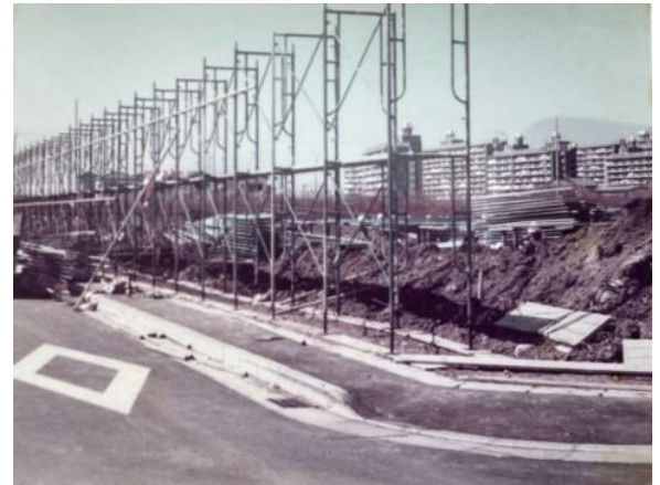
(↑校庭の南中側から撮影した写真。足場を組み始めた頃です。遠くに堀江団地が見えます。)

昭和57年には、南葛西第二小学校の開校により南葛西小から605名の児童が移籍、平成元年には南葛西第三小学校の開校により268名の児童が移籍という経過をたどり、そこからは現在の規模と大体同じ20学級前後で推移しています。