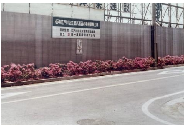
(↑バス通り側から見た写真。「仮称江戸川区立第八葛西小学校新築工事」の文字が見えます。)

校長室にある「南葛西小学校建設時の様子～完成まで」のアルバムを見ると、開校から9年前、昭和45年12月から区画整理が始まっていたようです。その当時は、学校周辺には民家が点在する程度で、遠くに堀江団地やなぎさニュータウンを望めます。また、建設時は学校名が、仮称ではありますが「江戸川区立第八葛西小学校」だったようです。それが地域名である「南葛西小学校」として開校したのも、地元の方々の学校への並々ならぬ思いの表れだったのではないのでしょうか。