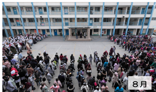
今年8月下旬の新学期の朝会の様子