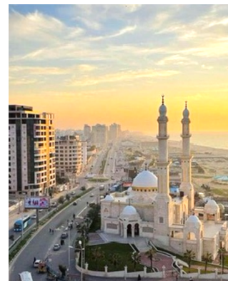
紛争前のガザ地区の街の様子

前のお便りでお伝えしましたように、 ここヨルダンに住む人口の約半数はパレスチナ出身の方 と言われており、 私が毎日活動している UNRWA (ウナルワ) の学校の子どもたち、先生方、職員の方は全員パレスチナ出身の方 です。そのため紛争が始まった10月7日以降は、ヨルダン国内も これまでの「日常」とは変わってきています。 そして、 「ガザ地区」は、今現在も大きな被害を受けており、これまでの「日常」が失われてしまいました。