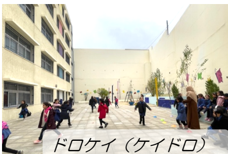
ドロケイ (ケイドロ)

(こちらの歌を歌いながら遊んでいます。本当は帽子を使いますが、子どもたちは毎日持っているわけではないので、ティッシュ等を使って遊んでいます。)