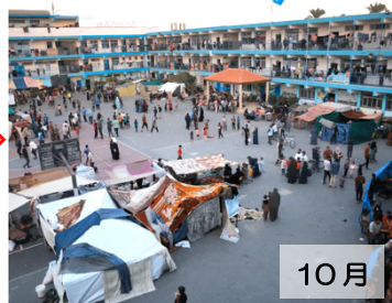
避難所になった UNRWA の学校。(155 校に約 140 万人。12/20 時点)