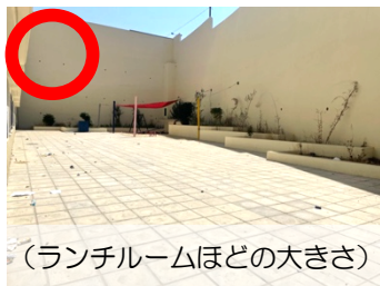
(ランチルームほどの大きさ)