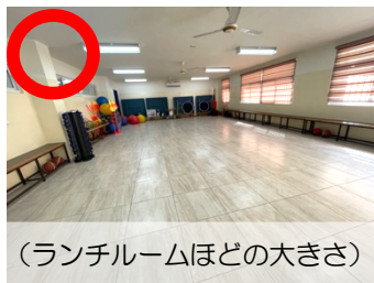
(ランチルームほどの大きさ)