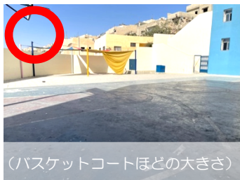
(バスケットコートほどの大きさ)