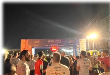
↑ マラソンスタート前。 日の出を見ながら走りました。⇒

そしてヨルダン国内には、1年間に数回 マラソン大会 があり、10月には「 アンマンマラソン 」がありました。私も同じ協力隊員の仲間と参加しました。真っ暗な中、朝6時に出発し、走っている間に日の出、朝日が見え、とても綺麗でした。子どもの部にも、 ヨルダンの子ども達や日本の子ども達も参加 していました。