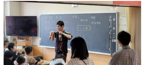
子どもたちに1年間の学習の見通し