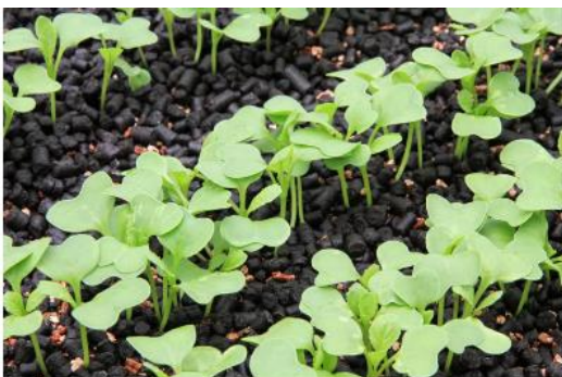
【発芽した小松菜の様子】

植木鉢の持ち帰り、ありがとうございます。今回の取組は、生活科の栽培活動で学んだことを家庭でも生かすことをねらいとしたPTAの学年学級活動の一環の取組になります。植木鉢にたくさんの芽が出ている場合は、間引きも必要です。ぜひ、おいしく食べられるように育ててみてください。少し生育したころは、やわらかく、野菜の味が苦手なお子さんでもおいしく食べられます。間引いた苗もサラダやみそ汁の具などにしながら、家族で江戸川区の「伝統野菜・小松菜」を味わっていただけますと幸いです。