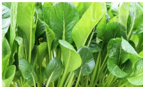
【成長した小松菜の様子】