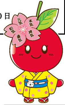
ちえりっ子ちゃん