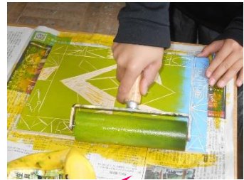
刷る時のドキドキ感・・・きれいに刷れた！