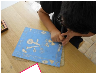
初めての彫刻刀。持ち方のきまりを守って安全に・・・