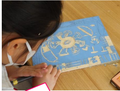
いろいろな彫刻刀を使い分けて彫っています。