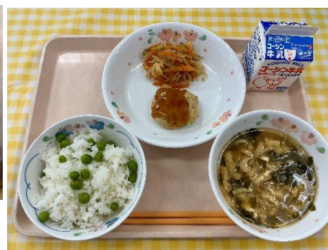
ぴかぴか光るグリーンピースご飯！みんなで「おいしい！」の大合唱でした☆