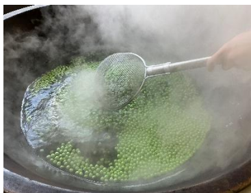
ゆでると鮮やかな緑色に！