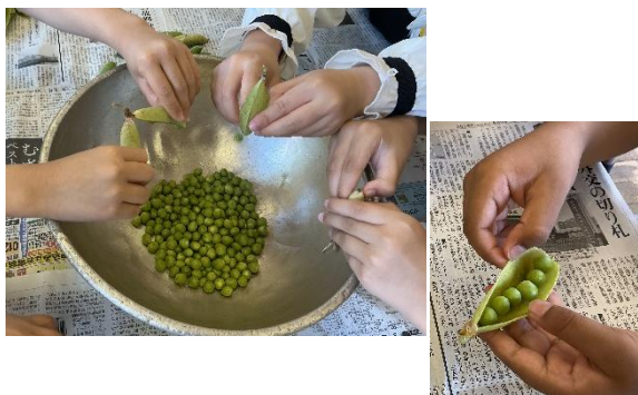
かわいいグリーンピースにみんな大興奮♪

待ちに待った給食の時間、「グリーンピースは苦手。」と話していた児童も、「がんばったからおいしい！」「グリーンピースごはん大好きになった！」と笑顔で話してくれました。次の日も、「さやとりまたやりたいなあ。」「またたべたいなあ。」と、改めて、食育の楽しさを感じたひとときでした。