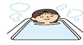
お風呂でしっかり湯船につかりよう