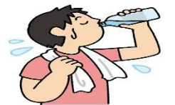
汗をかいたらこまめに水分補給