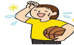
基本はしっかり汗をかくこと

毎日少しずつ1～2週間続けると体が暑さに慣れて、熱中症になりにくくなります(暑熱順化)