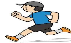
毎日、少しずつでも運動しよう