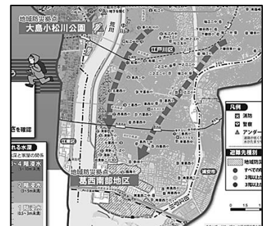
② 地域防災拠点への避難

広域避難が間に合わない場合は、江戸川区南部一帯は、臨海・清新地域の「地域防災拠点」に避難することとなります。